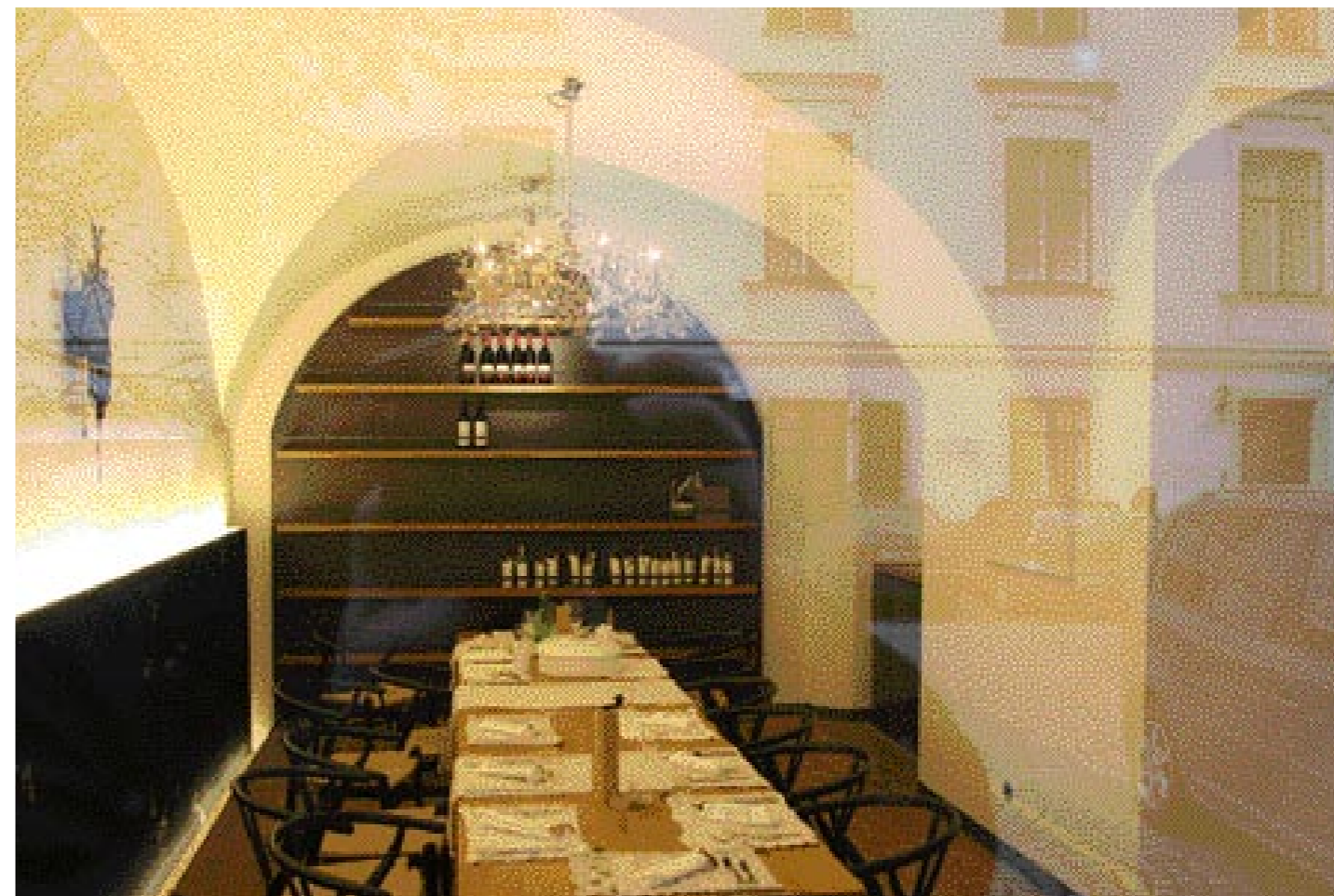
» Eines der beiden ische mit schweren Eichenplatten und feinen Leinenplatzdeckchen tafeln. An der Wand links die überdrübere Schwarzwälderuhr aus Edelstahl, deren elfenbeinfarbener Kuckuck pünktlichst ruft ...