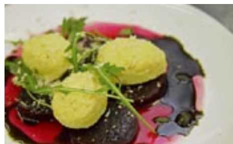
» Das gibt Kraft: Die Krennockerln auf Roten Rüben waren vom ersten Tag an Publikumsbeliebte